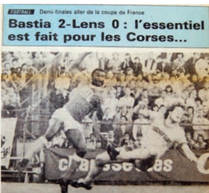
Les drapeaux ont claqué au vent

In meza finale a sorte manda u RC Lens nant'à a strada di u Sporting, cum'è in 72. A frebba s'impatrunisce di a Corsica è in Furiani l'ambianza è di livellu aurupeu. U SECB tene u risultatu ideale nanz'à un ritornu chì serà difficile in u Nordu, davant'à 40.000 sustenidori.